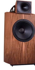
GENUIN FS 1