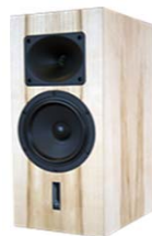
TEMPESTA 17 BKS